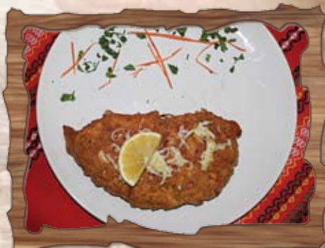
Пълнена пилешка пържола (7,10) /с кашкавал, гъби, шунка, кисели краставички/ 350 гр./ ..... лв.