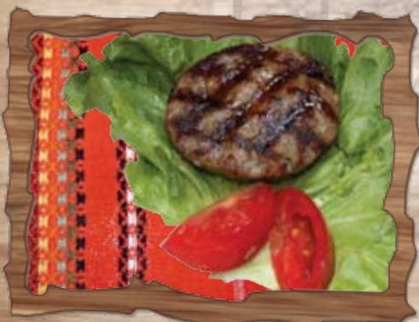
Кюфте 80 гр./ ..... лв.