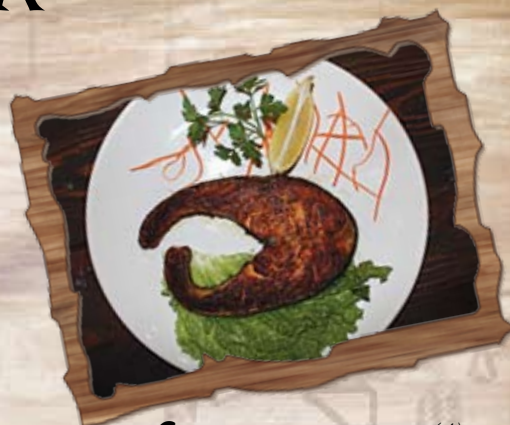
Сьомга котлет (4) 220 гр./ ..... лв.