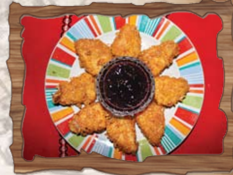
Топени сиренца с корнфлейкс (1,3,7) 240 гр./ ..... лв.