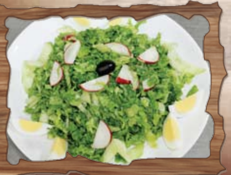
Зелена салата с яйце (3) 300 гр./ ..... лв.