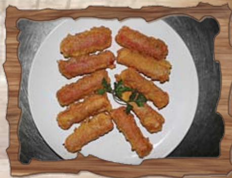
Панирани рулца от раци (1,3,14) 250 гр./ ..... лв.