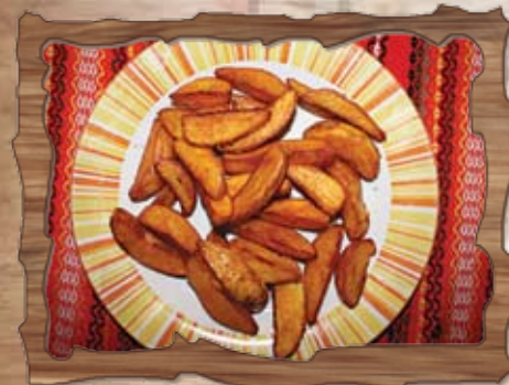
Селски картофи с кожа 250 гр./ ..... лв.