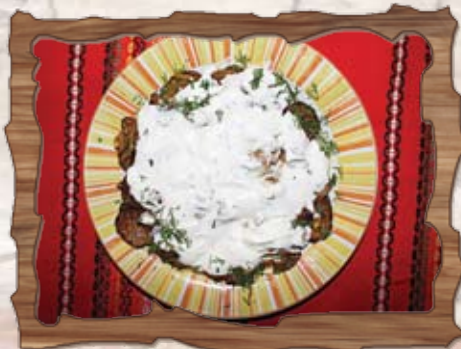
Подлучени тиквички с кисело мляко (7) 300 гр./ ..... лв.