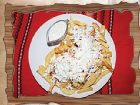
Пържени картофи със сос и сирене (7) 400 гр./ ..... лв.