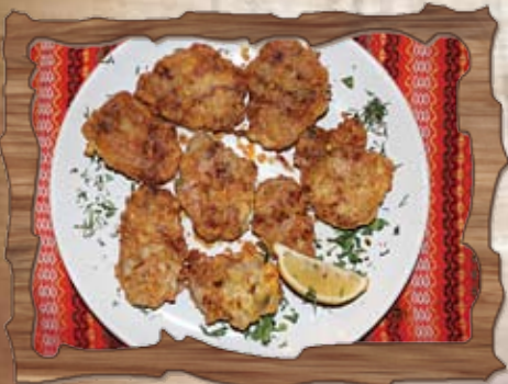
Език пане (1,3) 250 гр./ ..... лв.