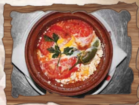
Сирене по шопски (7) 350 гр./ ..... лв.