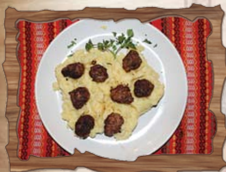
Кюфтенца по цариградски 450 гр./ ..... лв.