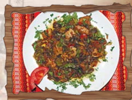
Свинска кавърма 350 гр./ ..... лв.