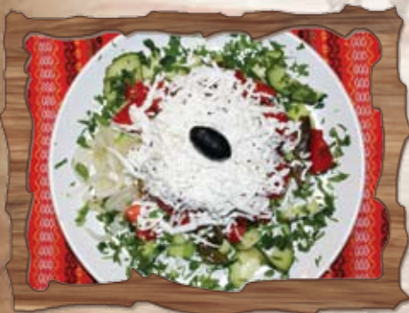
Шопска салата (7)