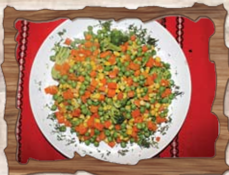
Задушени зеленчуци 300 гр./ ..... лв.