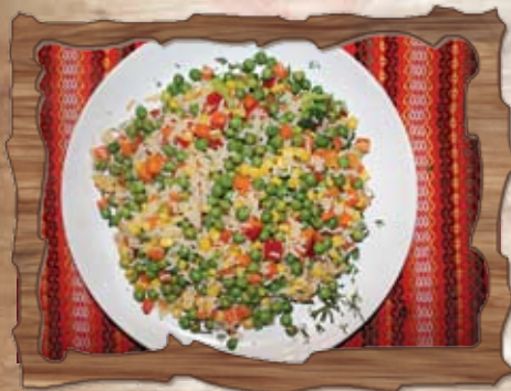
Ризото със зеленчуци 400 гр./ ..... лв.