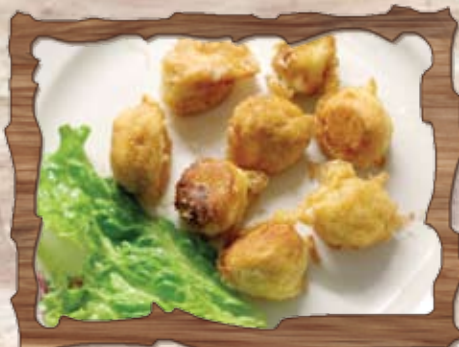
Панирани сиренца (1,3,7) 180 гр./ ..... лв.