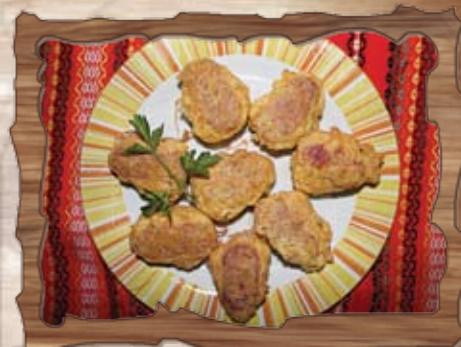
Панирани топени сиренца с луканка (1,3,7) 200 гр./ ..... лв.