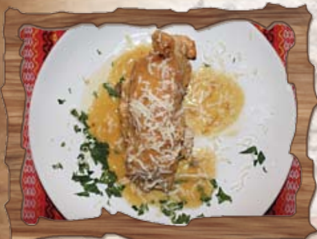
Пилешко вретено (7) 250 гр./ ..... лв.