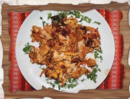
Пиле по селски (3) /сухи чушки, домати, пилешко месо, яйца, лук/ 350 гр./ ..... лв.