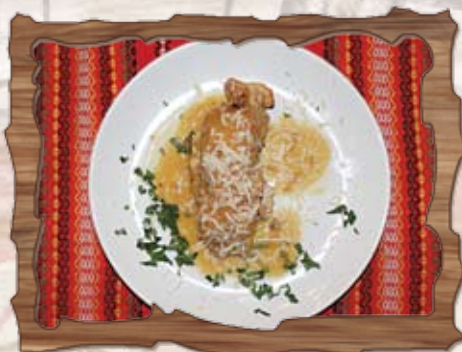
Свинско вретено 250 гр./ ..... лв.