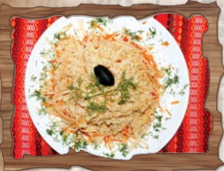
Морковена (8) / с ябълки и орехи/ 400 гр./ ..... лв.