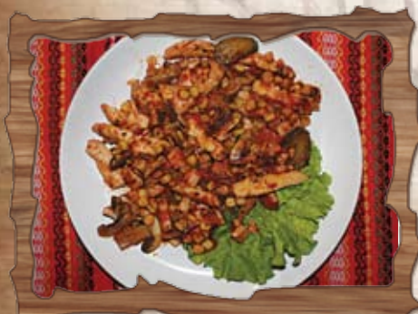
Пиле по родопски (10) /доматен сос, пилешко филе, шунка, гъби, кисели краставички, царевича, чубрица/ 350 гр./ ..... лв.