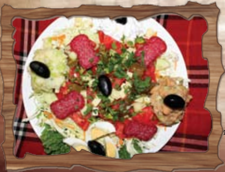
Салата Асорт (3,7)

/домати на шайби, печена чушка, катък, чесън, поръсени с пармезан/