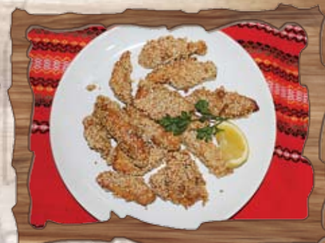
Пилешки късчета със сусам (1,3,11) 200 гр./ ..... лв.