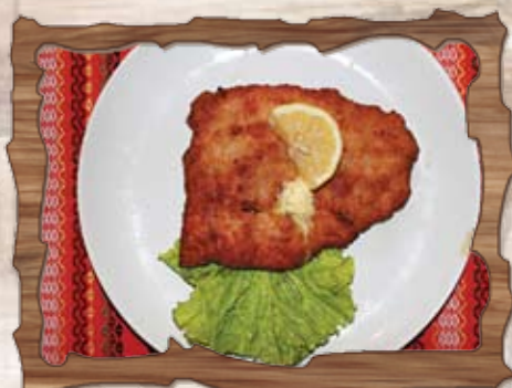
Шницел по виенски 200 гр./ ..... лв.