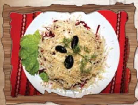
Пролетна салата (8)

/зеле, домати, печени чушки, яйце, свинско филе, краставици, колбас, маслини/