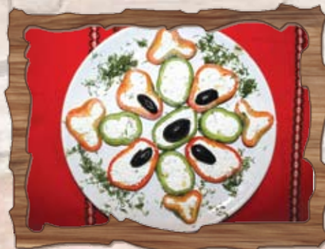
Лятна салата (3,7)