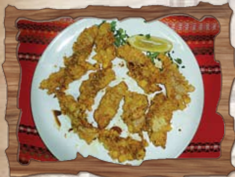
Хрупкави пилешки филенца / с корнфлекс/ 220 гр./ ..... лв.