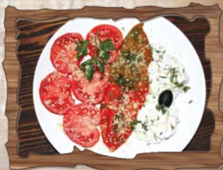
Чукуровска салата (7)