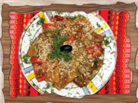
Печени чушки с чесън и орехи (8) 250 гр./ ..... лв.