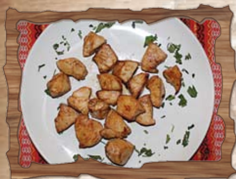
Пържено пилешко месце 200 гр./ ..... лв.