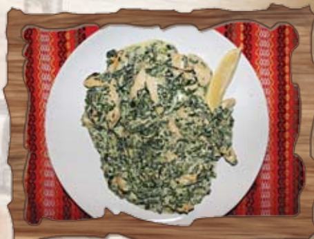
Пилешко със спанак и сметана (7) 350 гр./ ..... лв.