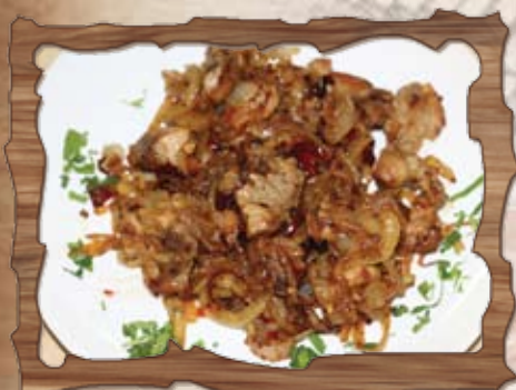
Подлютено свинско /врат, лук, чесън, лют пипер, суха чушка/ 300 гр./ ..... лв.