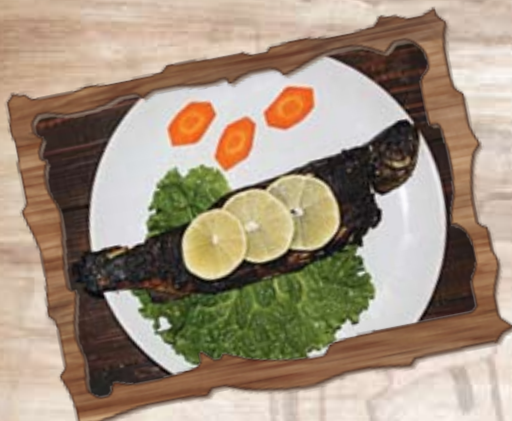
Пъстърва на плоча / в тиган (4) 300 гр./ ..... лв.