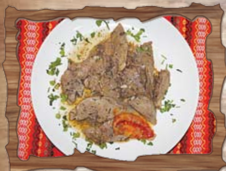
Език в масло 200 гр./ ..... лв.