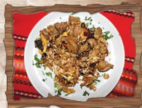
Свинско по селски (3) /сухи чушки, домати, свинско месце, яйца, лук/ 350 гр./ ..... лв.