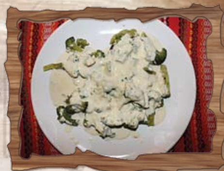
Броколи със сос рокфор (7) 350 гр./ ..... лв.