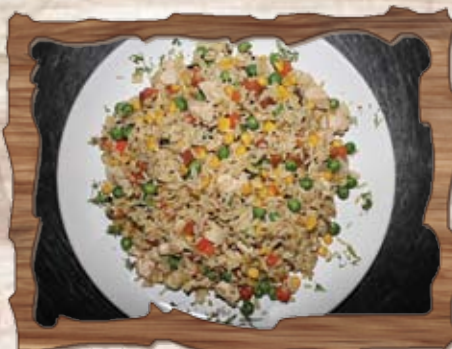
Ризото с пилешко месо 550 гр./ ..... лв.