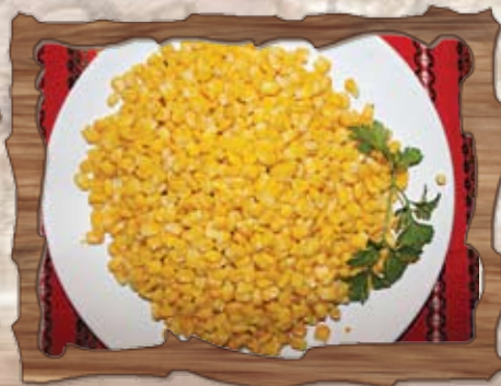
Задушена царевича в масло 220 гр./ ..... лв.