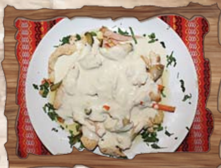
Жулиен (7,10) /бекон, гъби, пилешко месо, кашкавал, кисели краставички, моркови, сос Рокфор/ 350 гр./ ..... лв.