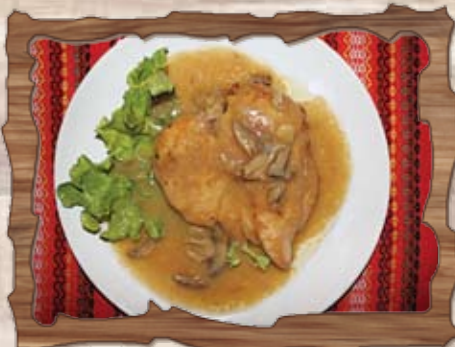
Пилешка пържола в гъбен сос 300 гр./ ..... лв.