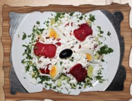
Овчарска салата (3,7)