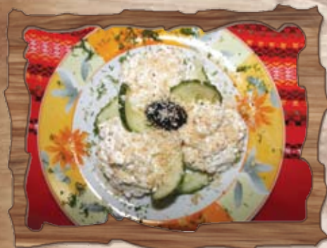
Домашен катък (7,8)