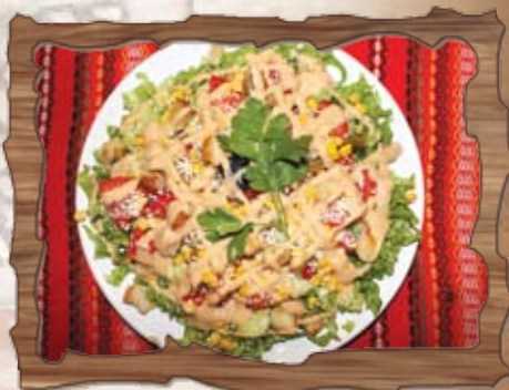
Есенна салата (7)

/пресни чушки, пълнени със сирене и яйце, нарязани на колелца/