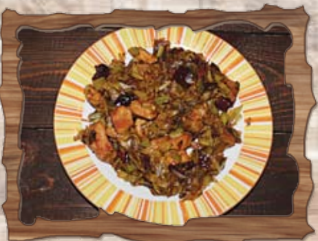
Клопаница /свинско с праз лук и сухи чушки/ 350 гр./ ..... лв.