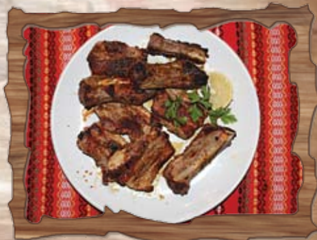
Свински ребърца (6) 400 гр./ ..... лв.