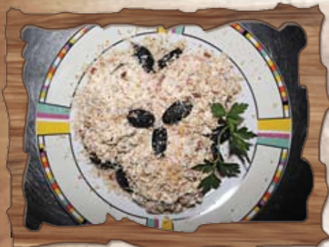
Бабина топеница (3,7,8)