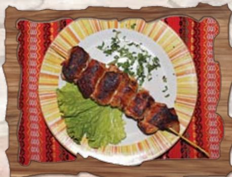
Пилешко шишче с бекон 150 гр./ ..... лв.