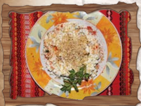
Нервозна топеница (7,8)

/пресен лук, печена чушка, домати, сирене, зехтин/