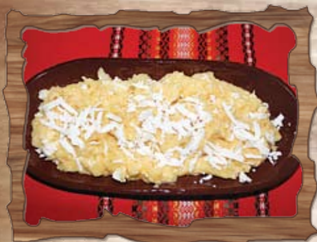
Качамак с овче сирене и кашкавал (7) 400 гр./ ..... лв.