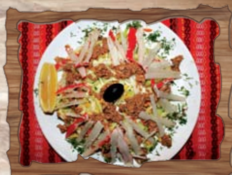
Морска салата (4,14) 300 гр./ ..... лв. /зеле, рула от раши, риба тон, краставици, царевича/