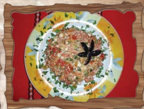
Габровска топеница (7)

/намачкани домати, люта пиперка, червен лук, зехтин, магданоз/