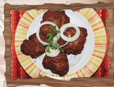
Пържени кюфтета 70 гр./ ..... лв.