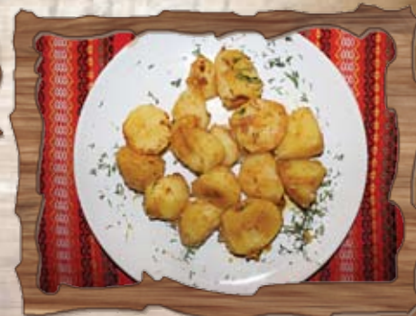
Задушени картофи с копър и чесън 300 гр./ ..... лв.