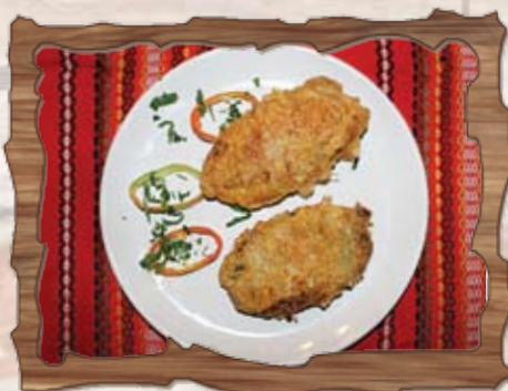
Чушки бюрек (1,3) 350 гр./ ..... лв.