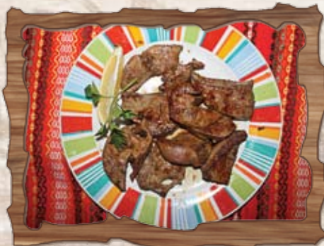
Свински дробчета в масло 200 гр./ ..... лв.