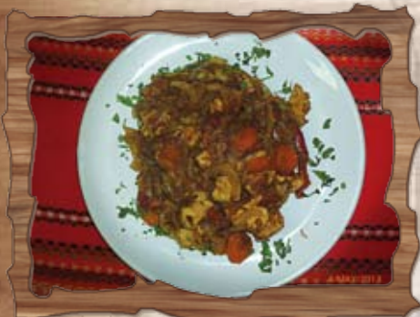
Пилешка кавърма 350 гр./ ..... лв.