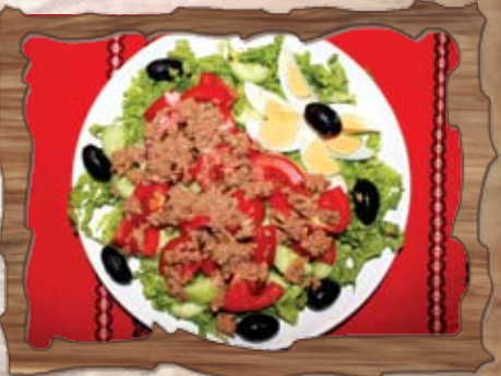
Салата „Ница“ (3,4) 350 гр./ ..... лв. /маруля, домати, краставици, яйце, риба тон, маслини/