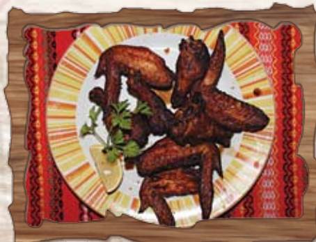
Пилешки крилца (6) 300 гр./ ..... лв.