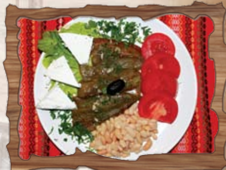
Калугерска салата (7) 350 гр./ ..... лв. /чушки, домати, боб, сирене/