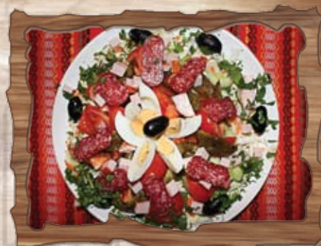
Английска салата (3)

/домати, краставици, маслини, сирене, едро нарязан червен лук/