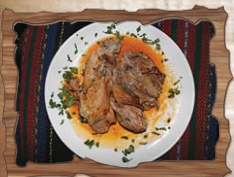
Свинско джоланче 450 гр./ ..... лв.