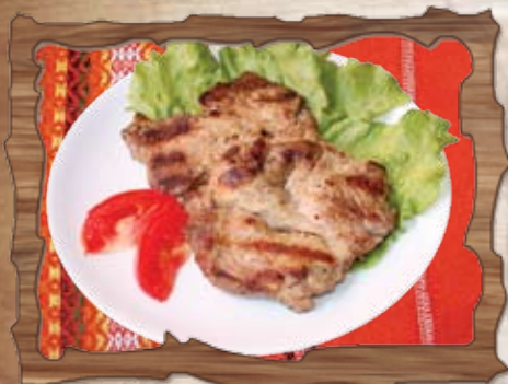
Свинско бон филе 200 гр./ ..... лв.