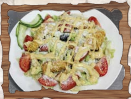
Салата Цезар (1,3,7) 470 гр./ ..... лв. /айсберг, домати, краставици, хрупкави пилешки филенца, крутони, пармезан, сос/