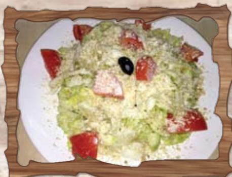
Свежа салата (8)

/цедено мляко, сирене, печена чушка, орехи, чесън, копър/