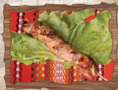
Свинско шишче 100 гр./ ..... лв.