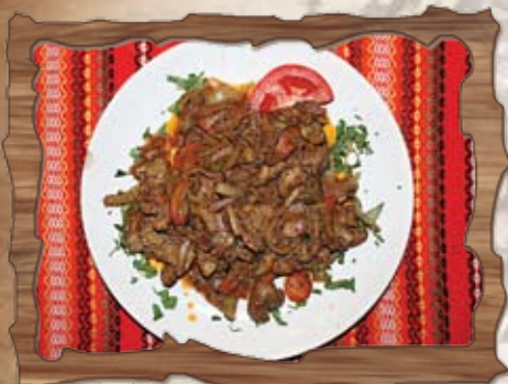
Пилешки дробчета по селски 380 гр./ ..... лв.