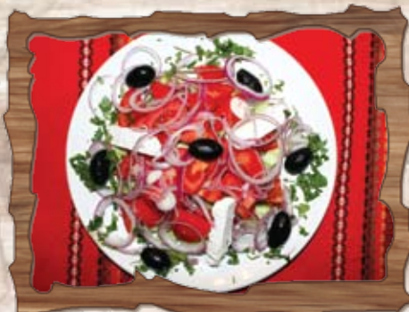
Гръцка салата (7)