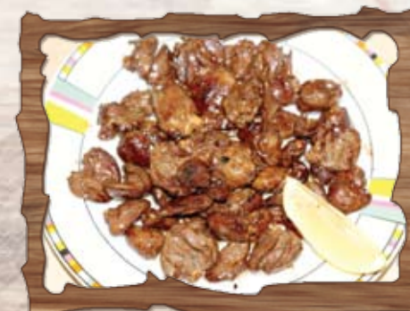
Пилешки сърца в масло 200 гр./ ..... лв.