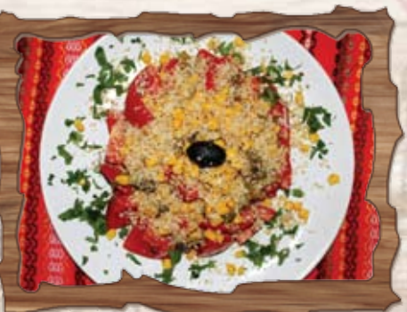
Жътварска салата (8)