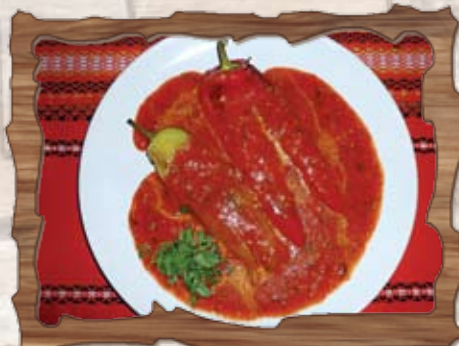
Печени чушки в доматиен сос 300 гр./ ..... лв.