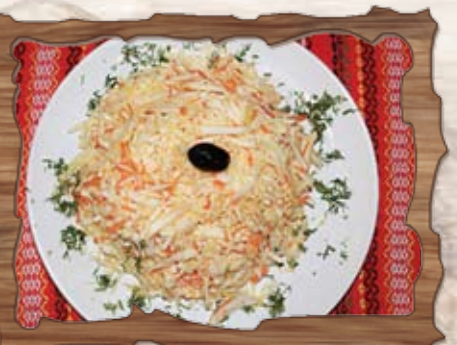
Зеле с моркови 400 гр./ ..... лв.