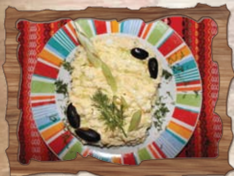
Зимна салата (3)

/зелена салата, домати, краставици, царевича, пресни чушки, крутони, пармезан, сос/