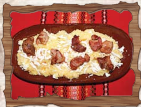
Качамак с пръжки и овче сирене (7) 500 гр./ ..... лв.