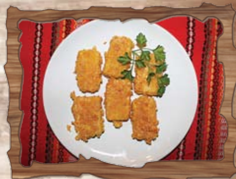
Панирани кашкавалчета с корнфлейкс (1,3,7) 220 гр./ ..... лв.