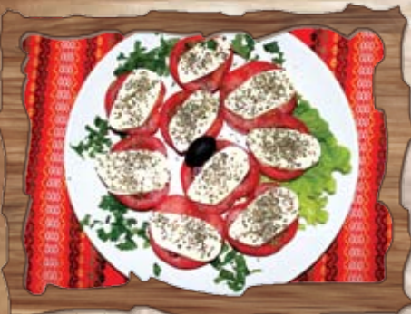
Домати с моцарела и босилек (7) 300 гр./ ..... лв.