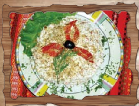
Селски катък (7,8)