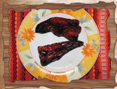
Пържена суха чушка 1 бр./ ..... лв.