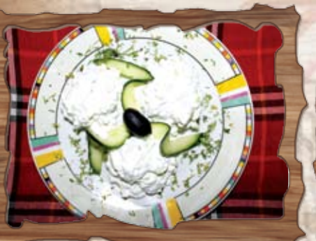
Млечна салата (7) 300 гр./ ..... лв.