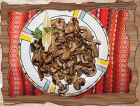
Пресни печурки в масло 200 гр./ ..... лв.